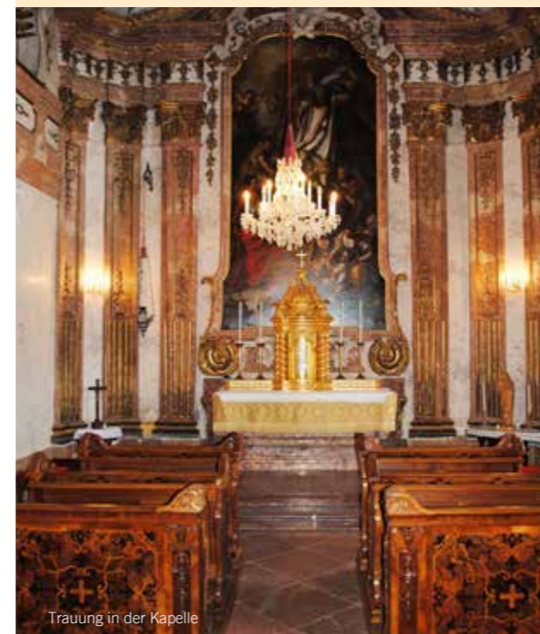
Trauung in der Kapelle