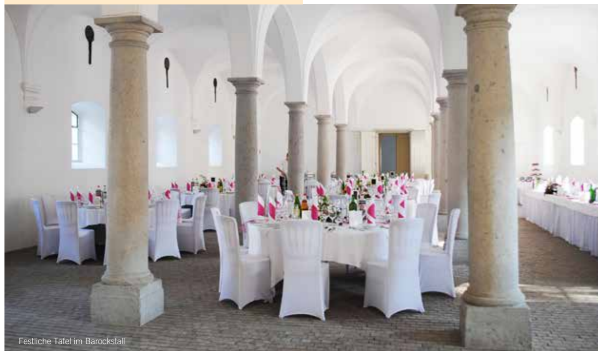
Festliche Tafel im Barockstall

Trauung im Barockgarten Aufpreis € 275,-