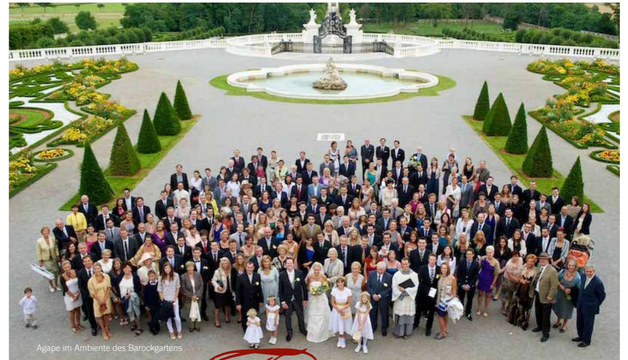
Agape im Ambiente des Barockgartens