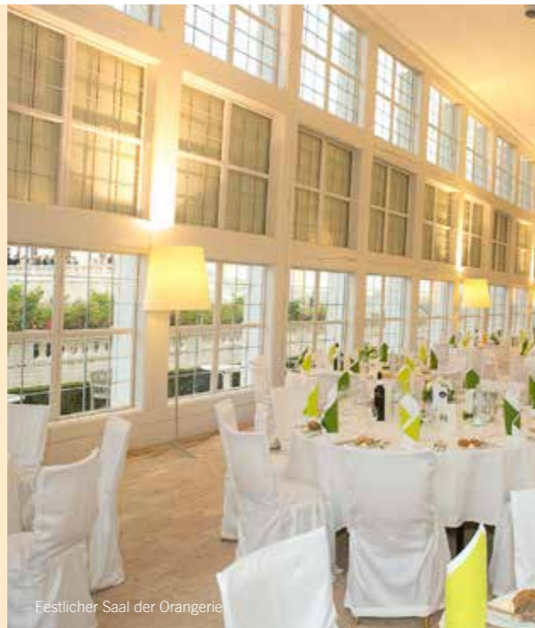
Festlicher Saal der Orangerie