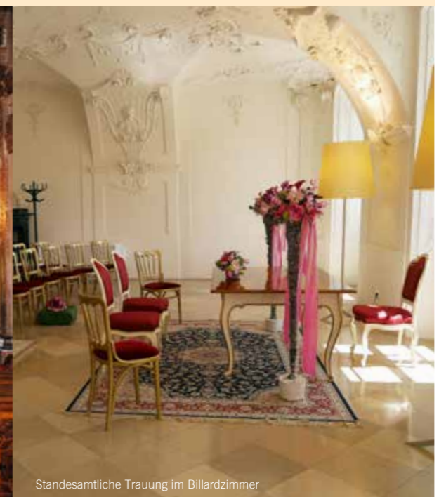
Standesamtliche Trauung im Billardzimmer